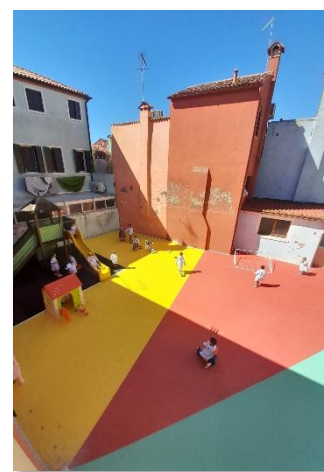
Alcune foto dell'interno del nido integrato e del cortile appena restaurato