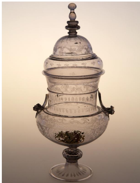
Manifattura veneziana; Seconda metà del XVI secolo Vetro incolore soffiato e lavorato a mano libera e a stampo; incisione a punta di diamante; pittura a freddo; doratura. H. cm 27,8 (con coperchio); diam. cm 12,3 Museo del Vetro di Murano, inv. Classe VI n. 1124 Provenienza Chiesa di San Martino di Burano (Venezia) Acquisto A. Barbini per il Museo Civico Vetrario di Murano, 1880