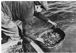
Pescatore al lavoro

Granchi "boni" e "mati" sotto i raggi. E' difficilissimo distinguerli, serve una nuova tecnica per conoscere quelle che diventeranno "gustose moleche".