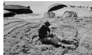
Pescatore che cuce le reti