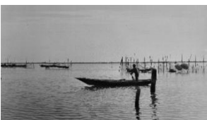
Vieri in laguna