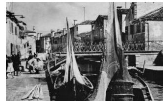
Rio delle Burchielle