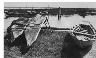
Barche da pesca tipiche a riposo