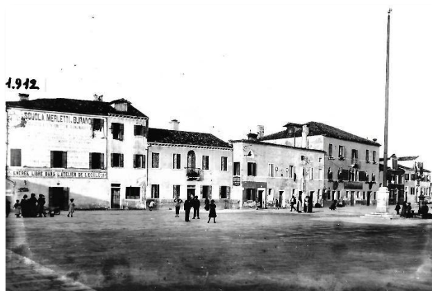
Piazza Umberto I. Burano 1912.