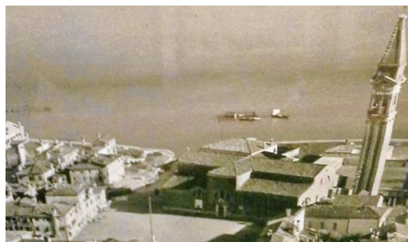
Foto aerea dell'isola. Burano 1970.