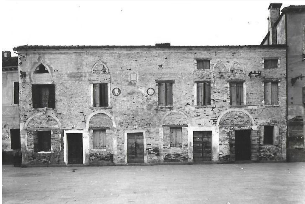
Palazzo del Podestà di Torcello. Burano, primi '900.