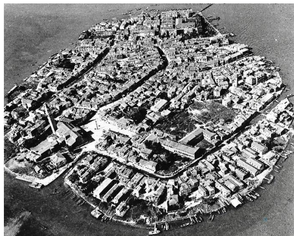
Foto aerea dell'isola. Burano anni '70.